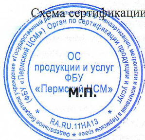
Схема сертификации: 1с. Знаком соответствия не маркируется.