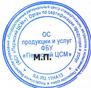
Схема сертификации: Зс. Знаком соответствия не маркируется