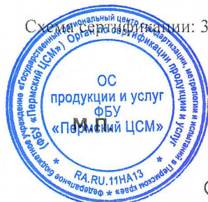
Схема сертификации: Зс. Знаком соответствия не маркируется